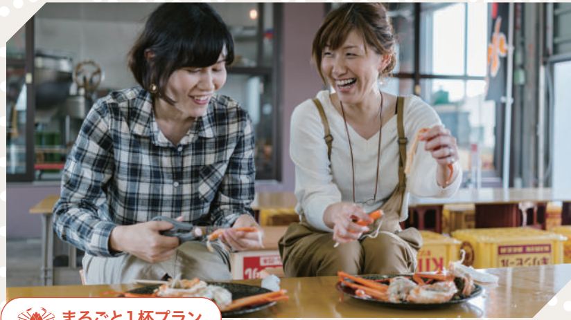
🍷 まるごと1杯プラン

全国的にも珍しい昼セリの見学に加え、新湊漁港で水揚げされたばかりの紅ガニ(ベニズワイガニ)を新湊かに小屋で食べることができます。